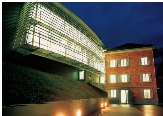
Hauptsitz der DACHCOM in Rheineck

Gesucht wurde eine moderne Systemlösung, durch welche die Erreichbarkeit der Mitarbeitenden und deren Benutzerkomfort beim Kommunizieren erhöht und zentral verwaltet werden konnte. Sie sollte zudem direkt mit der Groupware von Microsoft Exchange kommunizieren und auf die Datenbanken von Exchange zurückgreifen. Der besondere Anspruch: Da DACHCOM über 90% mit Macintosh Systemen arbeitet, musste dies auch zwingend reibungslos für Windows und Mac OS X funktionieren. Im Weiteren sollte die Lösung möglichst zukunftssicher sein und einen späteren Ausbau auf VoIP bieten. Ebenso wurde nach einer Möglichkeit gesucht, Voice Mail zentralisiert zu verwalten. <